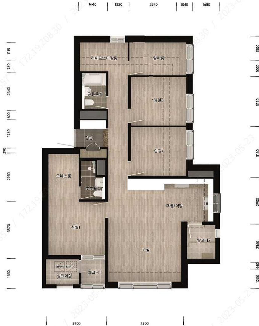
84B형 단위세대 평면도