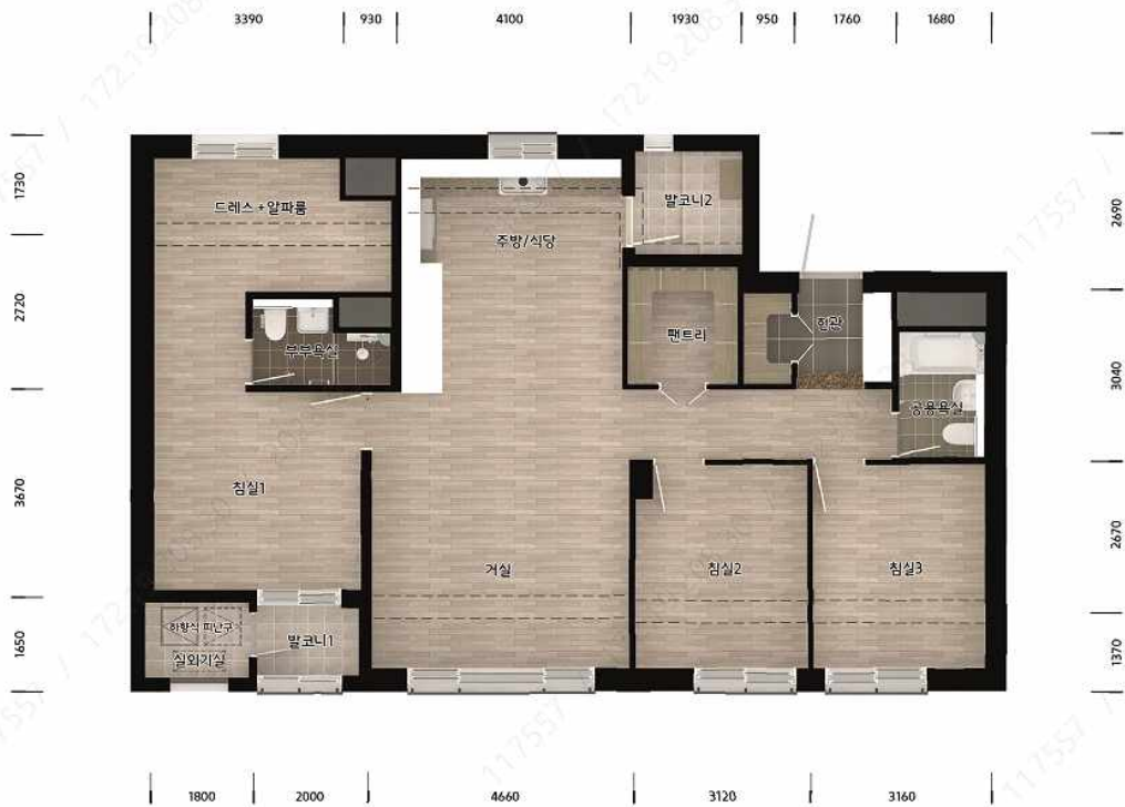
84A형 단위세대 평면도